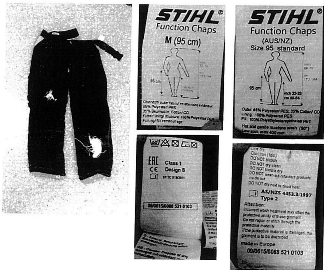
Function chaps 0088 521 0101-04 Labels inside

Model: Function chaps 0088 521 0101-04 (for size XS to L)